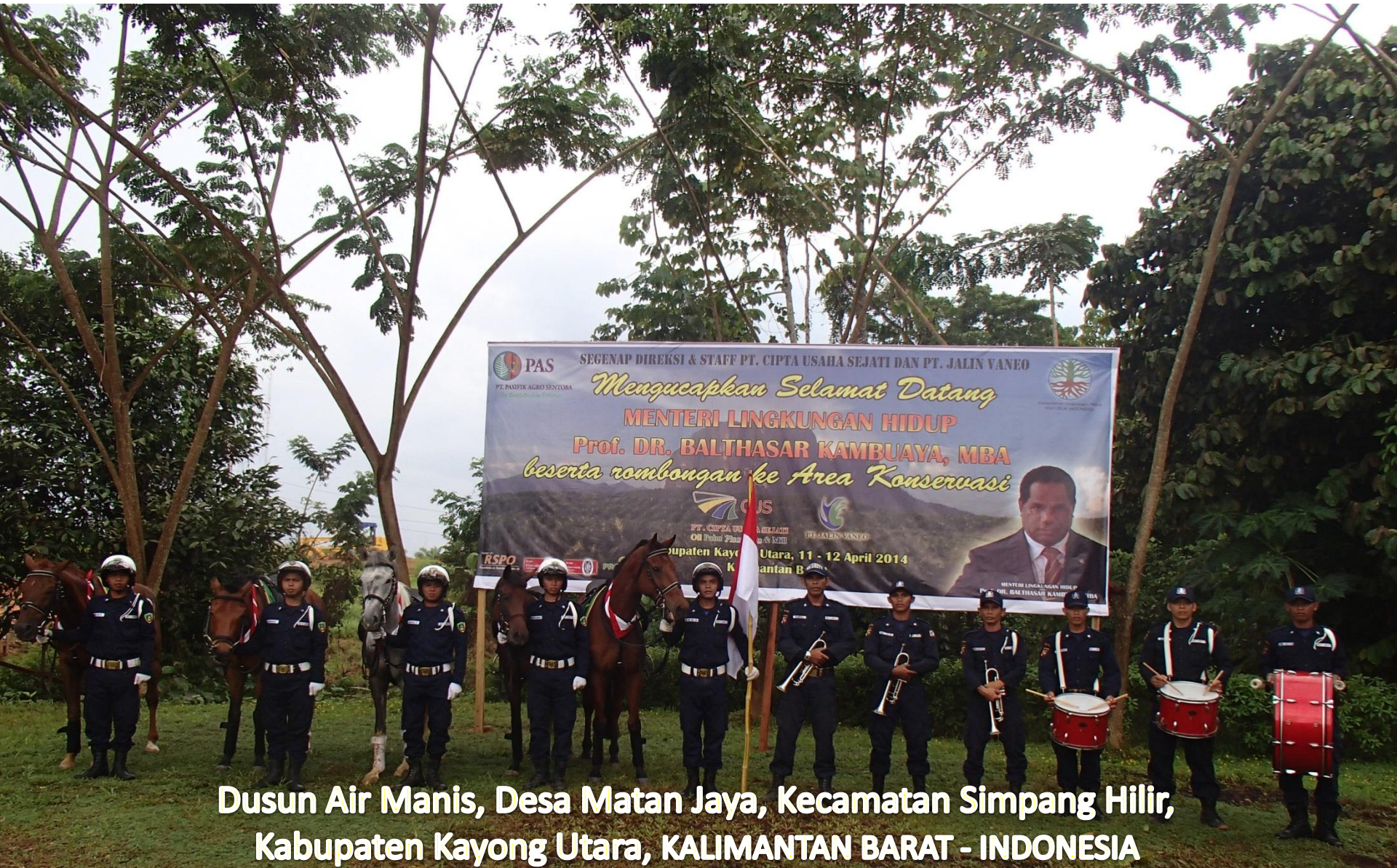
Dusun Air Manis, Desa Matan Jaya, Kecamatan Simpang Hilir, Kabupaten Kayong Utara, KALIMANTAN BARAT - INDONESIA